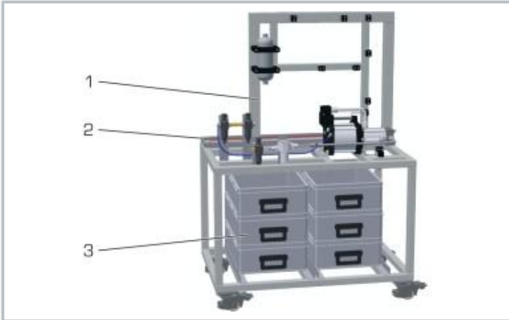
1 basic setup with pre-assembled gas booster, pressure vessel and compressed air connections on the laboratory side, 2 pipes for pipe assembly, 3 storage system with components, tools, spare parts