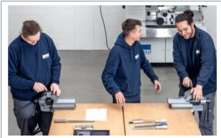
Manual work in preparation for pipe installation